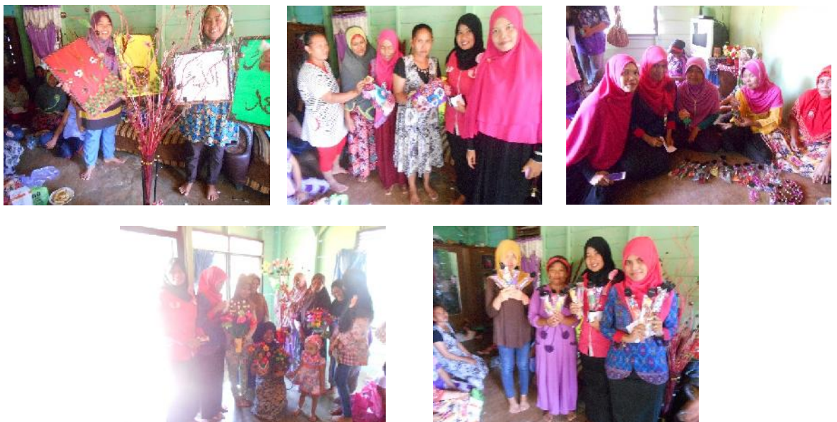
Gambar 7. Hasil Kreasi Kerajinan Berbasis Biji Karet Kelompok Tani Sekar Arum