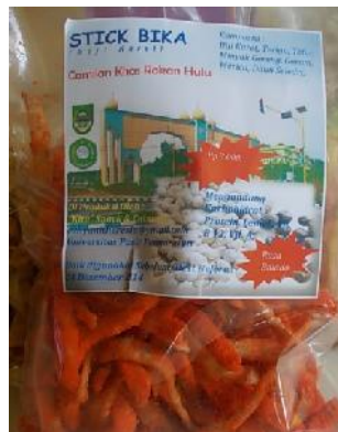
Jurnal Sungkai Vol.4 No.2, Edisi Agustus 2016 Hal :56-72