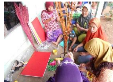
Gambar 5. Praktek Pemanfaatan Biji Karet Untuk Bahan Baku Kerajinan