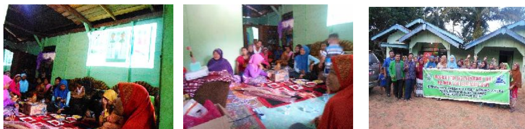
Gambar 4. Penyuluhan Pemanfaatan Biji Karet Sebagai Bahan Baku Stik Bika dan Kerajinan

sebanyak 25 orang ibu-ibu kelompok tani Sekar Arum. Antusiasme peserta dalam penyuluhan juga sangat baik yang ditandai dengan ; (1) keseriusan peserta dalam memperhatikan materi yang diberikan, (2) banyaknya pertanyaan yang diberikan oleh peserta kepada tim IbM, (3) ramainya diskusi antar peserta terkait materi yang disampaikan oleh tim IbM, serta keinginan peserta untuk segera mencoba mempraktekkan materi yang disampaikan.